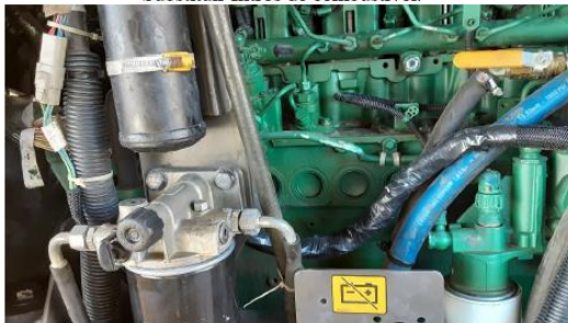
Substituir chicote de alimentação no motor!