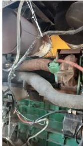
Substituir chicote do motor.