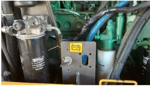
Substituir filtros de combustível.