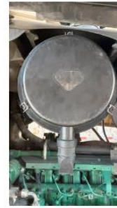
Substituir filtros de ar do motor.