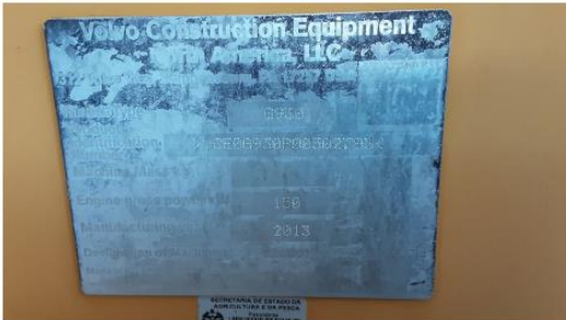
Plaqueta do N° de Série