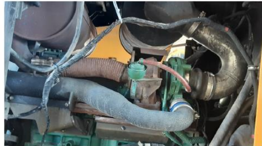
Substituir chicote do motor.