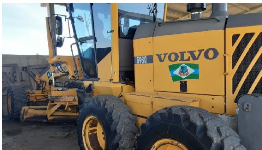
Máquina Na Operação