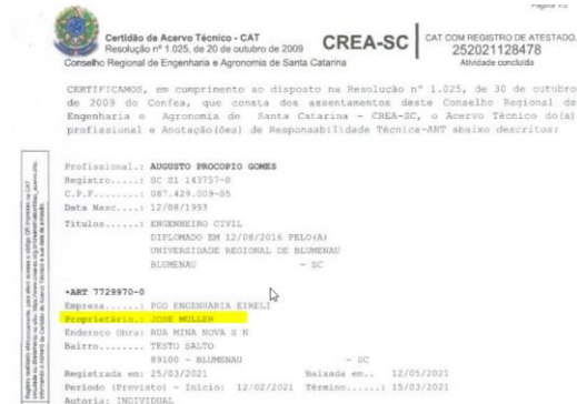
Figura 3 - CAT pessoa física