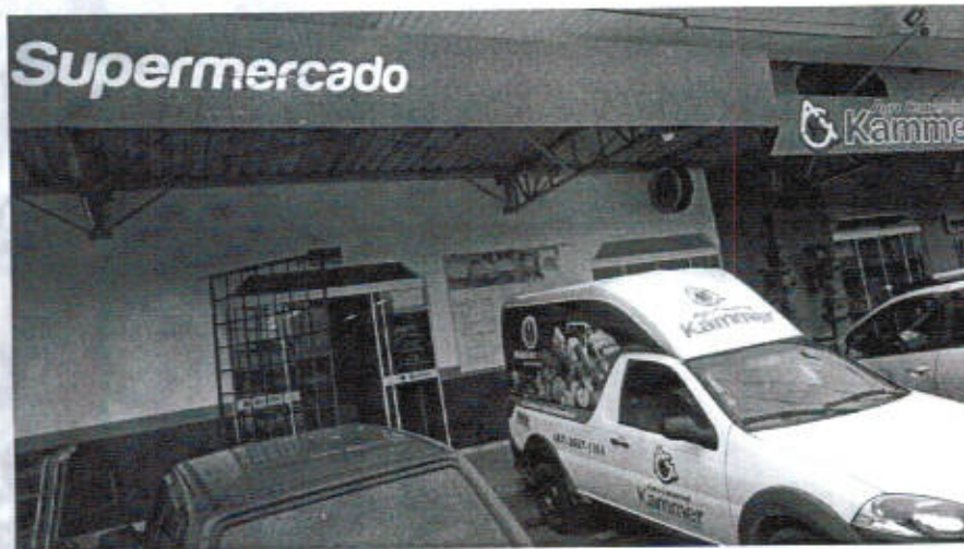
Figura 1 - Foto retirada do site da Rádio Sintonia FM