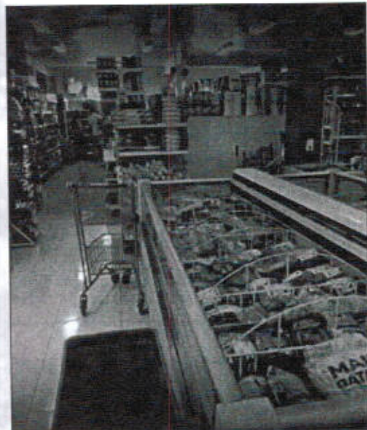
Figura 2 e 3 - Fotos retiradas do Google Empresas

Para confirmar a presente colocação, segue cópia do cartão CNPJ da empresa AGRO COMERCIAL KAMMER, para comprovar o ramo de atividade.